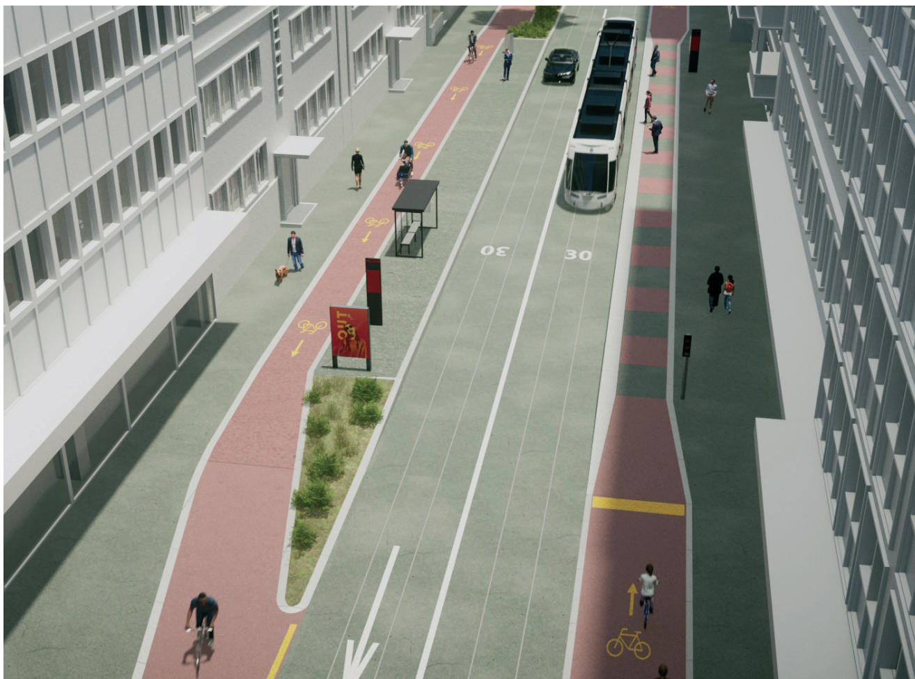
Visualisations des futures infrastructures cyclables: Conférence Vélo Suisse / co.dex production ltd. & Julien Joliat

Les documents ad hoc seront distribués lors de l'assemblée générale.