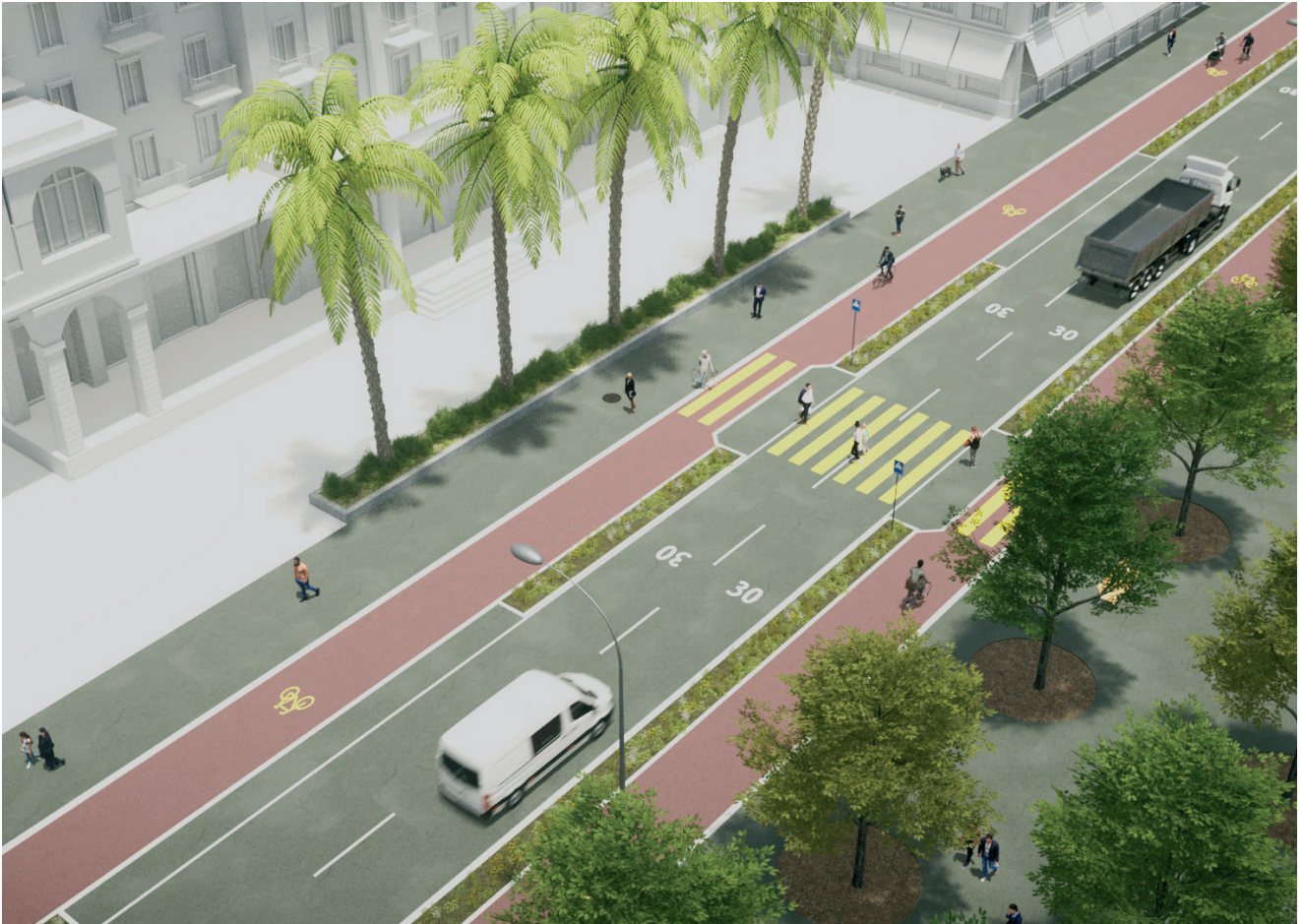
Visualisations des futures infrastructures cyclables: Conférence Vélo Suisse / co.dex production ltd. & Julien Joliat