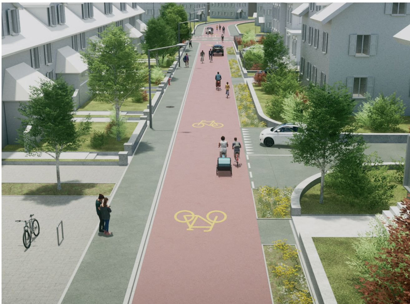
Visualisations des futures infrastructures cyclables: Conférence Vélo Suisse / co.dex production ltd. & Julien Joliat