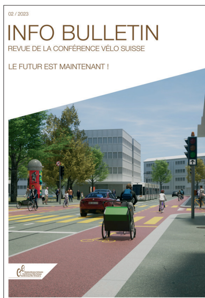
Info Bulletin 02/2023

Les voies centrales banalisées sont une épée à double tranchant pour le vélo. D'un côté, elles ne répondent pas aux critères d'une infrastructure cyclable de qualité. D'un autre côté, elles peuvent constituer une offre qui n'est pas sans intérêt aux endroits où d'autres solutions sont trop difficiles à mettre en place, ou une solution provisoire dans un tel contexte. Le webinaire, qui s'est tenu le 14 mars 2023, a réuni 264 personnes, avec traduction simultanée en allemand et en français. Lien