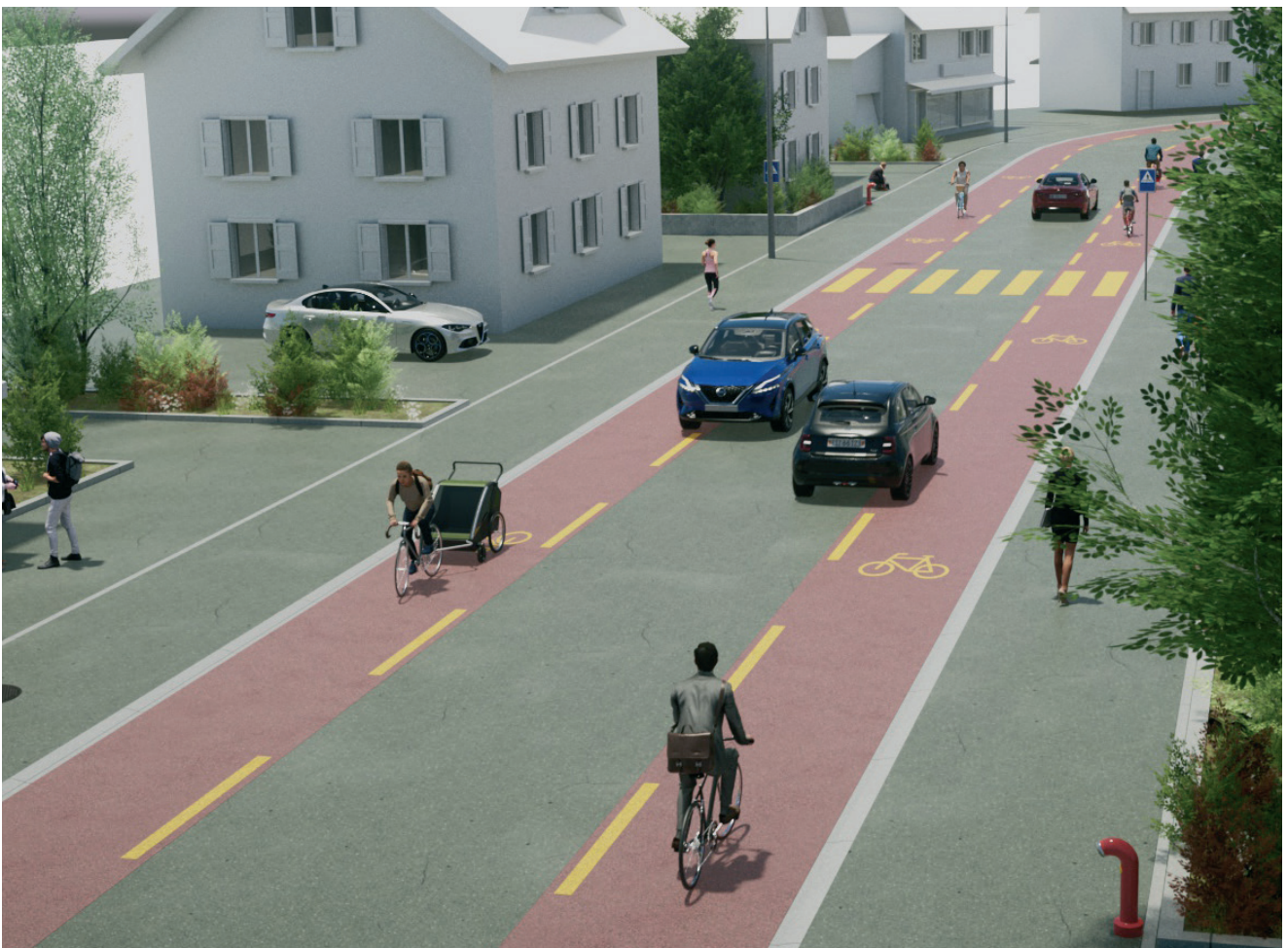
Visualisations des futures infrastructures cyclables: Conférence Vélo Suisse / co.dex production ltd. & Julien Joliat